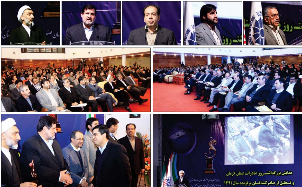
همایش بزرگ‌گشتر روز صادرات استان کرمان و تجلیل از صادرکنندگان برگزیده سال ۱۳۹۱