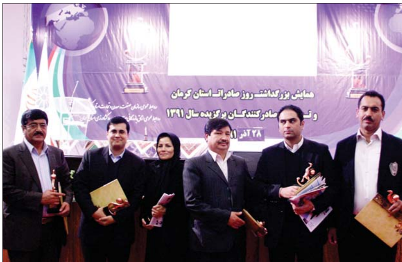
همایش «روز صادرات» / صفحات ۳ و ۴

▣ نایب‌رییس اتاق ایران در همایش «روز صادرات» در کرمان: (صفحات ۵ و ۴)