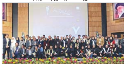
کادر اجرایی راهنمایان کرمان