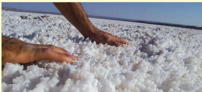
ساحل دریای نهفته