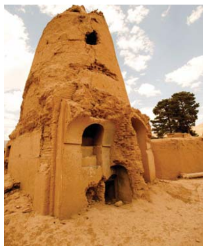
➤ برج محله چماه کوهبنان

در منطقه کوهبنان بلحاظ موقعیت کوهستانی و ژئوپلیتیکی آن نیاز به برج های دیده بانی و قلعه های مستحکم برای دفاع از مرز های شمالی استان را داشته است بهمین دلیل در قتل این منطقه و روستاهای آن اغلب برج های دیده بانی مستحکمی احداث شده که اکنون بخش از آنها بعنوان آثار بجا مانده از تاریخ گذشته خودنمایی می کند. مشاهده این برج ها و تفکر در مورد آنچه که این سنگها و گل ها دیده اند یک جاذبه گردشگری است.