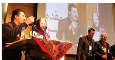
سخنرانی خانم فلیسیتاس در سالن اجتماعات دانشگاه هایتک