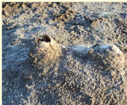
جوشش های تخم مرغی