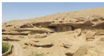
تصویری بخش غربی روستای دره گزک در این تصویر غارهای دست کند در آبرفت های جوان دیده می شود.