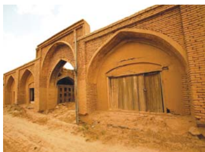
➤ بخشی از بازار قدیمی کوهبنان و درب ورودی تیمچه علی خانی

زمین لرزه سده دوازدهم میلادی که آثار آن در بین اهالی به گود زلزله مشهور است، در سده چهاردهم میلادی که آثار آن در روستای گور در محلی بنام زلزله سنگ بجای مانده است، در سال ۱۸۷۵ میلادی، در آوریل ۱۹۱۱ و در نوامبر ۱۹۳۳