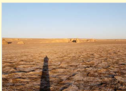
حوزه مرطوب چاله رود شور