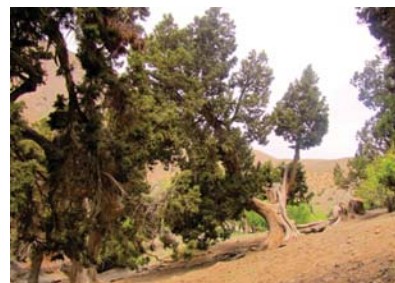
➤ تصویر جنگل اورس واقع در دره درهود کوهبنان

سیلا نام محلی درخت اورس است. تاکنون ۶۰ گونه اورس در جهان شناخته شده است. اورس یا هرس گونه ای سرو Juniperus است. اورس از رسته مخروطیان، رده نازویان، راسته کاجیان و تیره سرویان می باشد. این درخت در مناطق کوهستانی می روید و در مقابل نامالایمات طبیعی بسیار مقاوم است. این درخت و جنگل های باقیمانده از آن جزء مناطق حفاظت شده هستند.