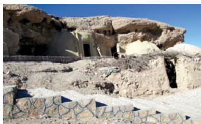
منظره عمومی روستای دره گزک، در این تصویر بخش غارهای دست کند در سمت چپ و خانه های گلی جدید در سمت راست دیده می شود.

روستای صخره ای دره گزک در روستای دره گزک سنگ نبشته ای یافت شده که بنا به اعتقاد دکتر نجمی متعلق به دوره قبل از آشنایی با خط است و احتمالا قدمت ۳ تا ۴ هزار سال دارد. در روستای دره گزک بخشی از رسوبات حاشیه رودخانه بصورت غارهایی به عمق یک اتاق شبیه میمند شهر بابک حفر شده که محل سکونت بوده است. بازسازی بخشی از این اتاق ها انجام شده و ثبت میراث فرهنگی است و این امکان بوجود آمده تا بخشی از تاریخ گذشته در معرض بازدید گردشگران داخلی و خارجی قرار بگیرد. سایر دیدنیهای روستای دره گزک آکواریوم طبیعی که با چشمه آرتزین تغذیه می شود، برج و قلعه و رودخانه زیبایی است که در فصل های پر باران سطح آن پوشیده از نیزار می شود که در منطقه کویری چشم نواز است.