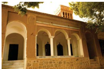
➤ خانه آل طه در کوهبنان