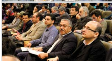
مراسم جشن راهنمایان گردشگری در سالن اجتماعات دانشگاه هایتک ماهان