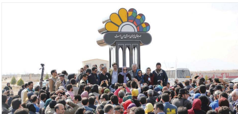
رونمایی از تندیس راهنمایان گردشگری در محور گردشگری هفت باغ علوی

هفتمین گردهمایی ۳ روزه راهنمایان گردشگری ایران به مناسبت روز جهانی راهنمایان گردشگری و با حضور فعالان این عرصه از سراسر ایران، خانم «فلیسیتاس رسنیگ» Felicitas Wressnig رئیس فدراسیون راهنمایان گردشگری جهان (WFTGA)، «هوشنگ مرادی کرمانی» و مهمانان ویژه در شهر کرمان، برگزار گردید. این گردهمایی با همت و حمایت اتاق بازرگانی، صنایع، معادن و کشاورزی کرمان و میزبانی و اجرای «انجمن صنفی راهنمایان کرمان» و با کمک دبیرخانه کانون و جامعه راهنمایان ایران انجام شد.