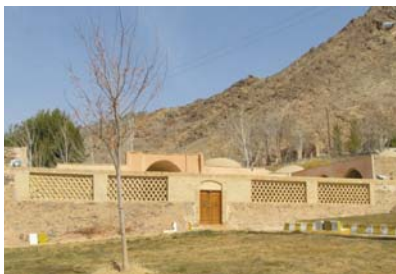
خانقاه شیخ ابوسعید ابوالخیر

کوهبنان محل تولد و زندگانی بنیانگذار سلسله نعمت اللهی، نورالدین نعمت الله پسر عبدالله مشهور به شاه نعمت الله ولی از نواده ای امام محمد باقر است. شاه نعمت الله در سال ۷۳۱ هجری قمری به دنیا آمد و ۱۰۳ سال زندگی کرد. تنها فرزند شاه نعمت الله، برهان الدین خلیل الله به سال ۷۷۵ هجری قمری در کوهبنان بدنیا آمده است. روایت شده در دامنه کوه مشرف به شهر شاه نعمت الله کلاسهای درس خود را دایر می نموده است.