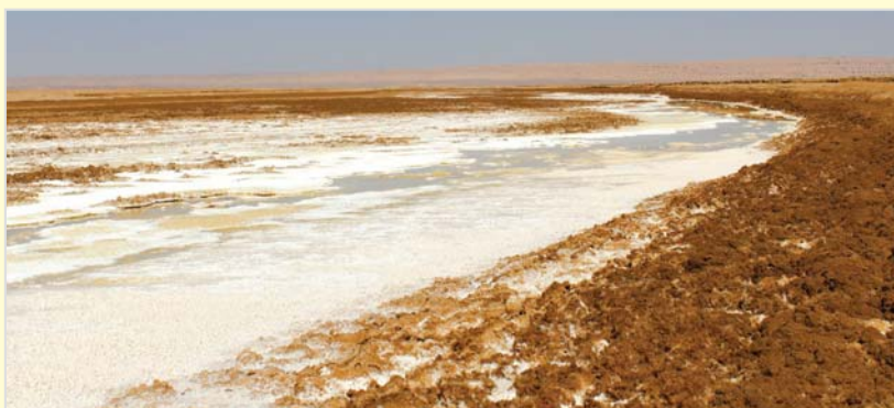
روان رود خشک رود