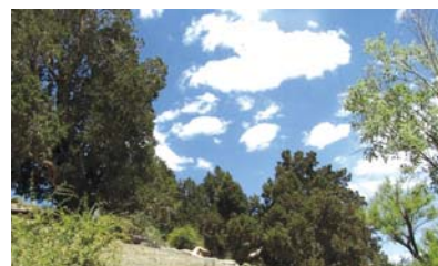
➤ تصویر جنگل اورس دره درهود کوهبنان، روستای دره هود در ۴ کیلومتری شمال کوهبنان در مسیر کوهبنان به سمت ده علی واقع شده است.