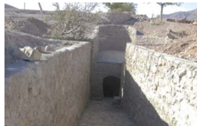
➤ تصویر یکی از راههای ورودی قنات کوهبنان

آسیاب های آبی کارخانه تولید آرد گندم و غلات می باشند. در آسیاب آبی با استفاده از تکنیک هیدرولیک و سرعت آب عمل آسیاب کردن انجام می شود. تعداد آسیاب های آبی جهان انگشت شمار هستند. در ایران از آسیاب های آبی اشکدر در استان یزد نام برده می شود که بعلت خشک شدن قنات آب همت آباد اکنون متروکه است. آسیاب های آبی خسروآباد طیس و گرمسیر تفت تا چندی پیش پا بر جا بوده اند. یکی از مزیت های آسیاب آبی کوهبنان این است که با یک رشته قنات تغذیه می شود و در گذشته نه چندان دور آرد گندم و غلات زرد، کرمان، رفسنجان و حتی بعضی از مناطق استان یزد را تهیه می کرده است. بخشی از این آسیاب بازسازی شده و در معرض دید علاقمندان به این صنعت آسیاب آبی می باشد.