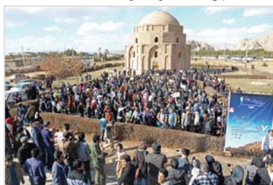
روز نخست گردهمایی و بازدید از کنبد جلیله