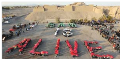
تشکیل حلقه انسانی مقابل ارگ قدیم بم