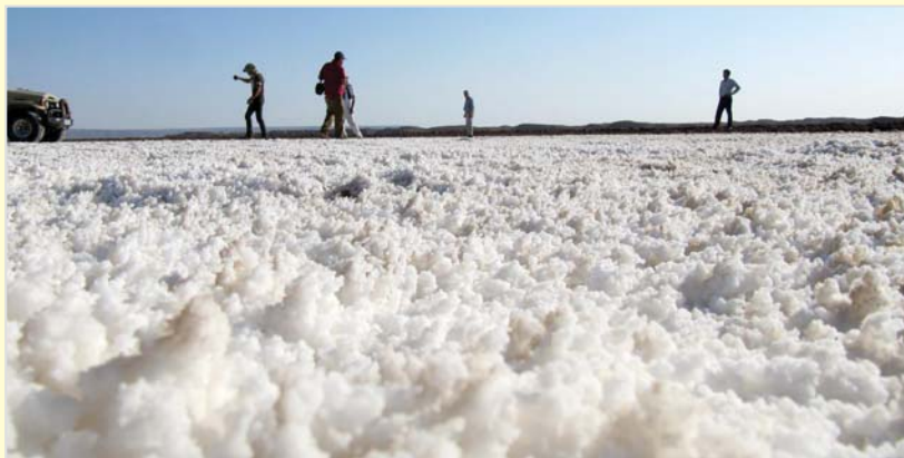
ساحل دریای نهفته