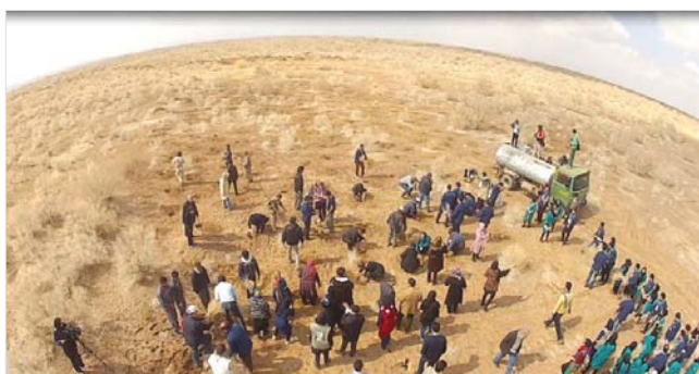
مراسم تاغ کاری در محور گردشگری هفت باغ علوی توسط راهنمایان گردشگری

یکم اسفندماه ۲۱ فوریه ۲۰۱۴ جشن با حضور مقامات کشوری و استانی، مهمانان داخلی و خارجی، حامیان جشن و حدود ۷۰۰ نفر راهنمای گردشگری در سالن اجتماعات دانشگاه تحصیلات تکمیلی صنعتی کرمان (هایتک) برگزار گردید، امید است با نهادینه شدن این رویداد و ثبت آن در حافظه تاریخی شهر کرمان، شاهد بازخورد مثبت آن در آینده گردشگری استان کرمان باشیم.