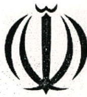
سازمان صنعت، معدن و تجارت استان گیلان