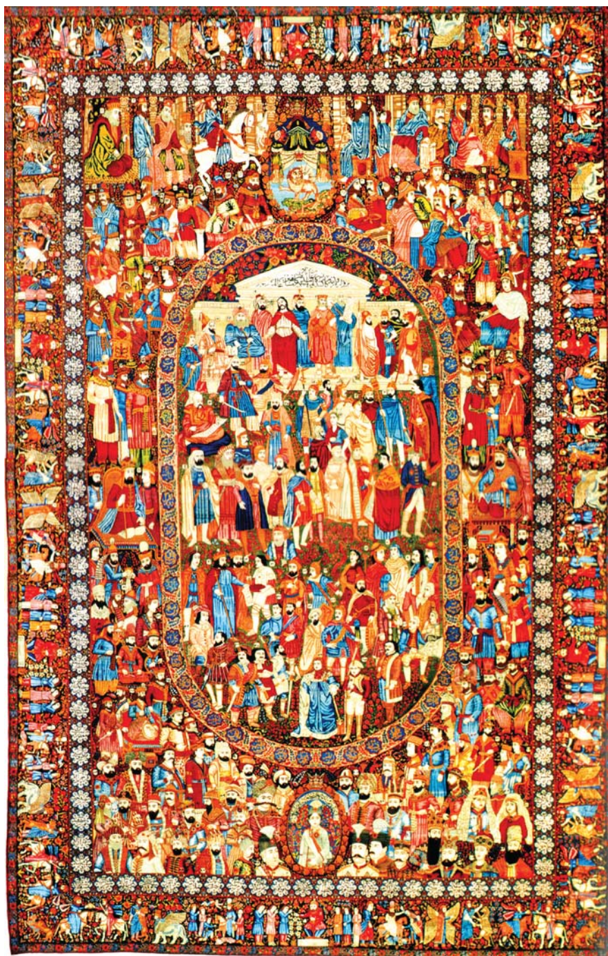
فرش مشاهیر / صفحه ۲