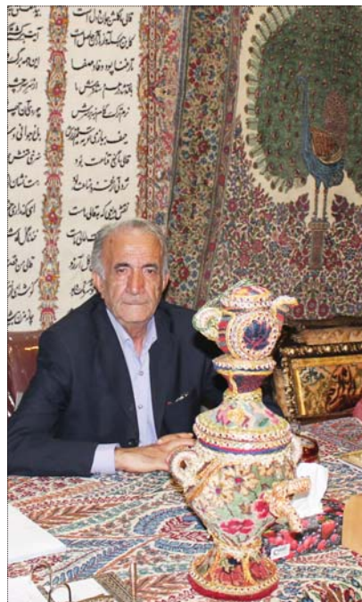
و جهان مطرح شده است.

وی در پایان از همه‌ی دستگاه‌ها و نهادهایی که برای برگزاری هرچه بهتر این نمایشگاه با اتحادیهی فرش دستباف کرمان همکاری کرده‌اند تشکر کرد.