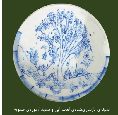
نمونه‌ی بازسازی‌شده‌ی لعاب آبی و سفید / دوره‌ی صفویه

کلام آخر: صنایع دستی ایران از قابلیت‌ها و پتانسیل‌های فراوانی برخوردار است که می‌تواند بخش اعظمی از صادرات غیرنفتی را پوشش دهد، اما به‌جای حمایت از این سرمایه‌ی ارزشمند و انتقال فرهنگ ایران‌زمین به سراسر جهان و زمینه‌سازی ایجاد شغل برای علاقه‌مندان به فعالیت در این حوزه، متأسفانه مورد بی‌مهری قرار گرفته و مهجور مانده است. با واردات صنایع دستی درجه‌چندم ایران، ضربه‌ی بدی بر پیکر برخی از رشته‌های صنایع دستی وارد آمد. در صورتی که با حمایت از صنایع دستی و مدیریت تولید آثار صنعتگران و هنرمندان می‌توان کارگاه‌های صنایع دستی را بر رونق نمود و نسبت به صادرات آن امیدوار بود. برای مثال با پیشینه‌ای که ایران در لعاب‌سازی دارد شایسته نیست با وارد کردن لعاب‌های آماده از سایر کشورها که در خیلی از موارد با اقلیم و شرایط ایران سازگاری ندارند به تزئین سفال‌ها بپردازیم. امیدوارم با حمایت برنامه‌ریزی شده و آگاهانه از صنایع دستی، شاهد رونق دوباره کارگاه‌ها در گوشه و کنار شهرها باشیم.