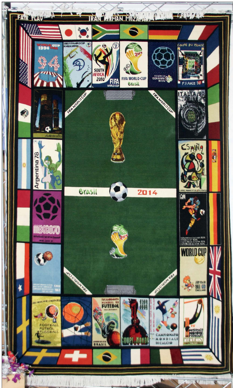
رنگمایی از قالیچه‌ی جام جهانی در کرمان، صفحه‌ی ۲