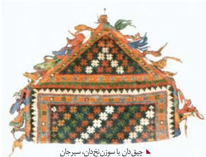
چیق دان یا سوزن نخ‌دان، سیرجان