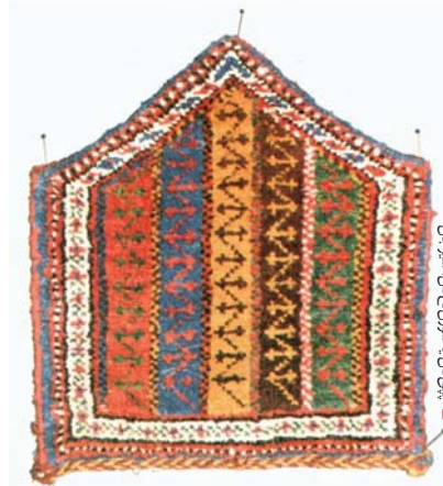
چق‌دان یا سوزن‌کشان، سیستان