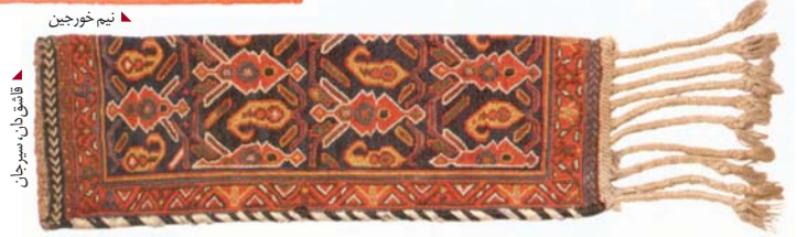
چیق دان، سیرجان

بر افشارها پیشی دارند، در تنوع به پای افشارها نمی‌رسند. بیش‌تر نمکدان‌های لری پیچ‌باف هستند، حال آن‌که افشارها همه‌گونه نمکدان از جمله پرزباف، پیچ‌باف و بافت جایگزین بافته‌اند و تنها به طرف نمکدان گلیمی نرفته‌اند. اندازه و قطع نمکدان‌های کرمانی، از جمله افشاری، با نمکدان‌های مناطق دیگر فرق دارد. این‌ها به‌طور معمول بزرگ‌تر هستند. بزرگ‌ترین نمکدان‌ها (در مقایسه با مناطق دیگر) در کرمان بافته شده است. بدنه‌ی نمکدان‌های کرمانی و افشاری مانند خورجین‌های آن‌ها در جهت مستطیل و به صورت افقی بافته شده است.