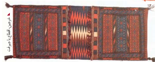
چیق دان، سیرجان