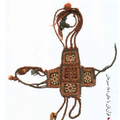
قران‌دان یا چکی دهه، سیستان

دسته‌ی کوچکی با پود جایگزین بافته شده‌اند. پشت هر دو دسته از گلیم ساده، با رنگ یک‌دست، ساده و با پاراه‌های پهن شکل گرفته است. بیش‌ترین رکعت را افشارهای جنوبی و منطقه‌ی جیرفت و اقطاع تولید کرده‌اند. بیش‌ترین رکعت‌ها پیچ‌باف هستند. جبال‌بارزی‌ها علاوه بر پیچ‌بافی، رکعت را با پود جایگزین هم می‌بافند. مهم‌ترین کاربرد رکعت برای ذخیره‌ی گندم، جو و آرد است. برای این‌که این محفظه‌ی بزرگ قابل حمل باشد وسط آن را می‌دوزند و آن را به صورت یک محفظه‌ی دوقلوی به‌هم چسبیده درمی‌آورند. گاهی هم به‌وسیله‌ی طرح آن، رکعت را به صورت دوخانه کنار هم می‌بافند. این روش در حفظ تعادل رکعت روی حیوان چهارپا بسیار موثر است؛ روشی که بختیاری‌ها در تاجه‌های خود به کار می‌برند. همان‌گونه که تاجه، محفظه‌ی ویژه‌ی بختیاری‌هاست، رکعت هم محفظه‌ی ویژه‌ی افشارهای جنوب است.