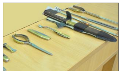
▲ نمونه‌هایی از آثار صنعت فلزکاری رای ▲ فسیل ایزبان، مربوط به سیصد میلیون سال قبل، رای