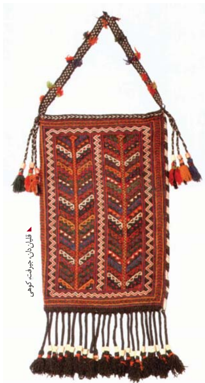
قلیان‌دان، چترت، کرمان

رکعت را باید بزرگ‌ترین محفظه‌ی دوبعدی (در مقابل مفرش‌های سه‌بعدی) خوانند. بعضی از آن‌ها به حدود ۱.۵*۱ متر یعنی به‌اندازه‌ی یک قالیچه رزق و نیم می‌رسد، به همین دلیل برخی از فروشندگان پشت رکعت را که گلیم ساده بافته شده است، جدا می‌کنند و روی رکعت را که نقش زیبایی دارد، با نام زیرانداز عرضه می‌کنند. رکعت‌های افشاری ساختار ویژه‌ای دارند. گروه بزرگی از آن‌ها به طریق پیچ‌باف و